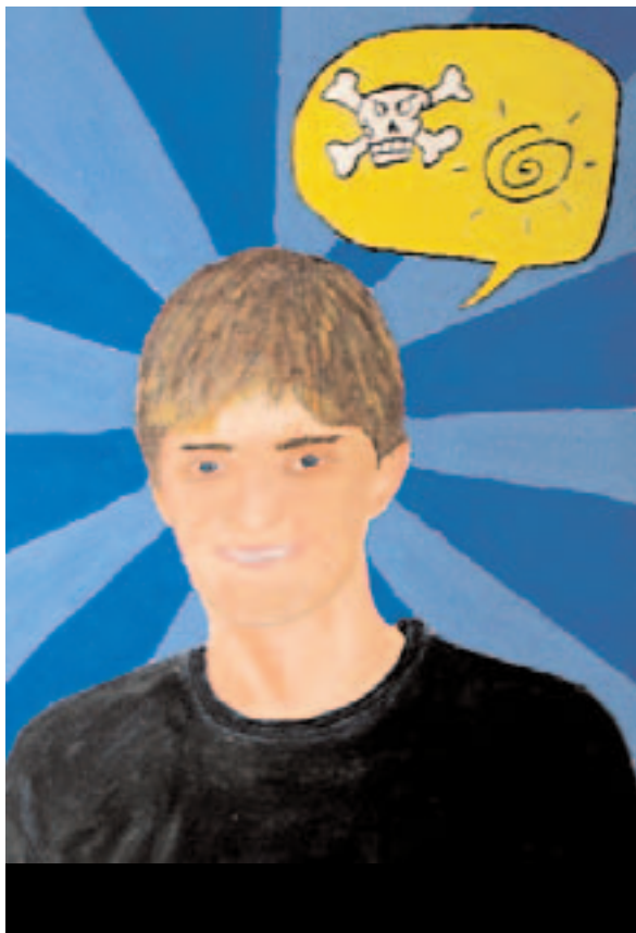
Fluchen dient hauptsächlich der Regulierung des seelischen Gleichgewichts, es ist aber auch Ausdruck grosser Bewunderung, des Erstaunens oder Erschreckens.

der Schritt vom Fluchwort zum Faustschlag ist manchmal nur klein. Trotzdem wird verbale Gewalt gesellschaftlich noch nicht so stark sanktioniert wie die körperliche Gewalt, und das scheint durchaus berechtigt zu sein, wenn man die Absicht und Wirkung des Fluchens genauer untersucht. So fungiert der Akt des Fluchens gleichzeitig als Katharsis und als Ressentiment oder Protest gegen gesellschaftliche Zwänge, und genau dadurch erlangt er seine wohl nützlichste Funktion: Er leitet eine grosse Menge aggressiver Energie ab, die sonst zu noch zerstörerischeren Zwecken missbraucht werden könnte. Schlussendlich ist Fluchen aber nicht nur gut fürs Gemüt, sondern auch für die Gesundheit, denn jeder Wutausbruch aktiviert die Magensäfte. Wird die Wut angestaut, riskiert man Magengeschwüre. Nur den Rat von Fluch-Papst Reinhold Aman sollte man sich immer zu Herzen nehmen: «Trägt der Gegner eine Waffe, kann Fluchen ungesund werden. Dann ist es ausnahmsweise besser, auf die Zunge zu beißen.» ■