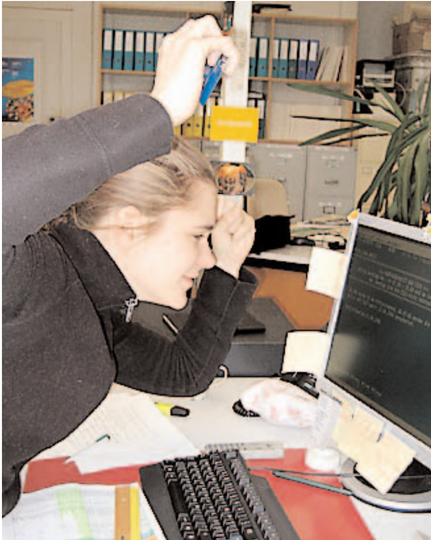
Als Akt der verbalen Gewalt steht das Fluchen oft nur kurz vor tätlichen Gewalthandlungen.

Kein anderes Wort erlangt eine solche emotionale Intensität wie das Fluchwort. Aller Grobheit zum Trotz ist es aber prinzipiell ein Handlungsersatz; physische Gewalt wird durch Verbalgewalt ersetzt. Die besondere Affinität zur Handlung zeigt sich darin, dass die Verbalaggression häufig effektiv in tätlichen Angriff übergeht,